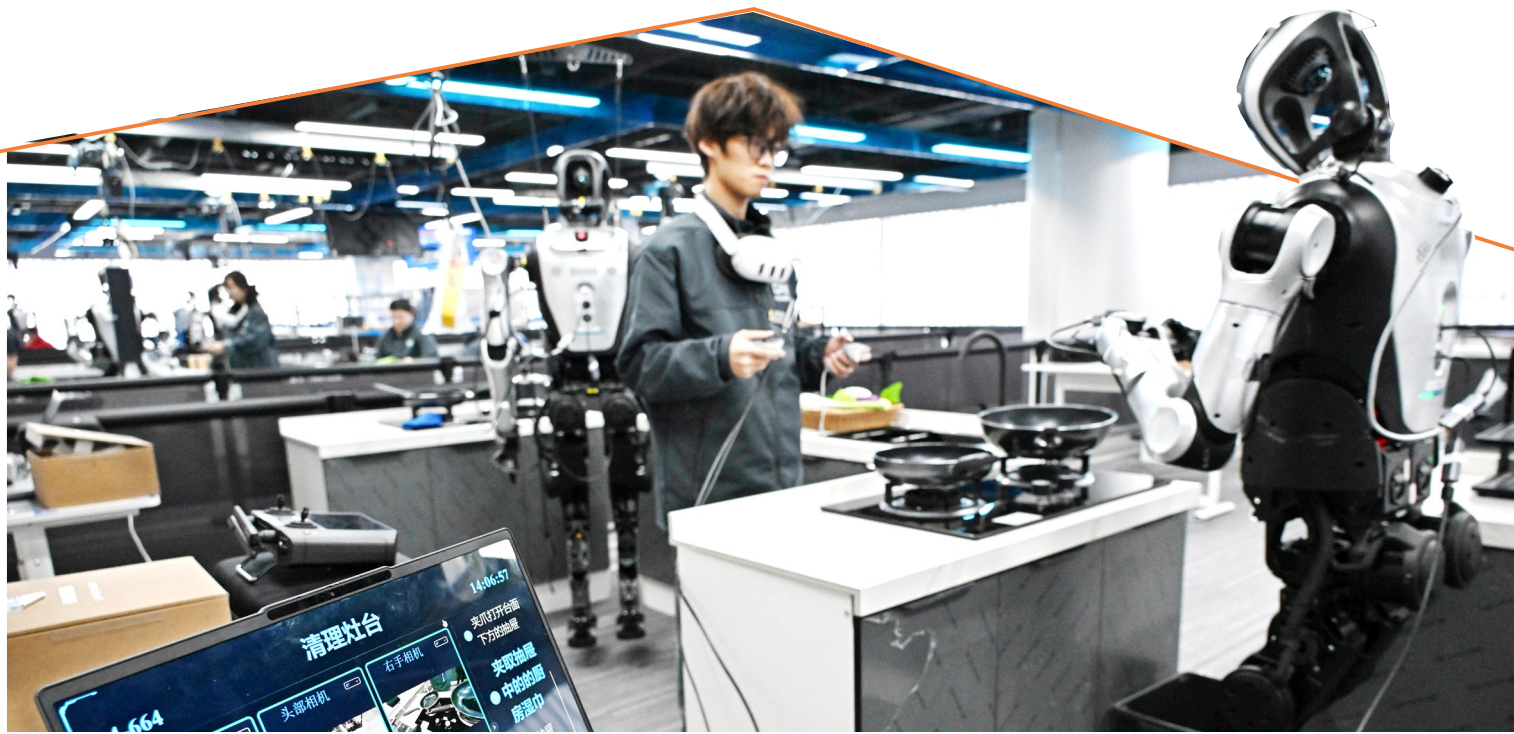
2026年3月23日，在山东省青岛市人形机器人数据采集训练场，训练师在居家收纳场景内指导机器人进行训练。