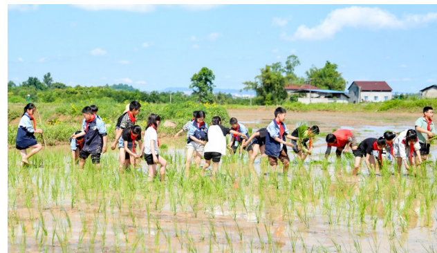
4月29日，在四川省华蓥市华龙街道东方村，学生在稻田里体验插秧。

“我们希望通过推广这种高速公路收费新模式，让大家的出行更安心、更舒心、更便捷。”杨亮说。