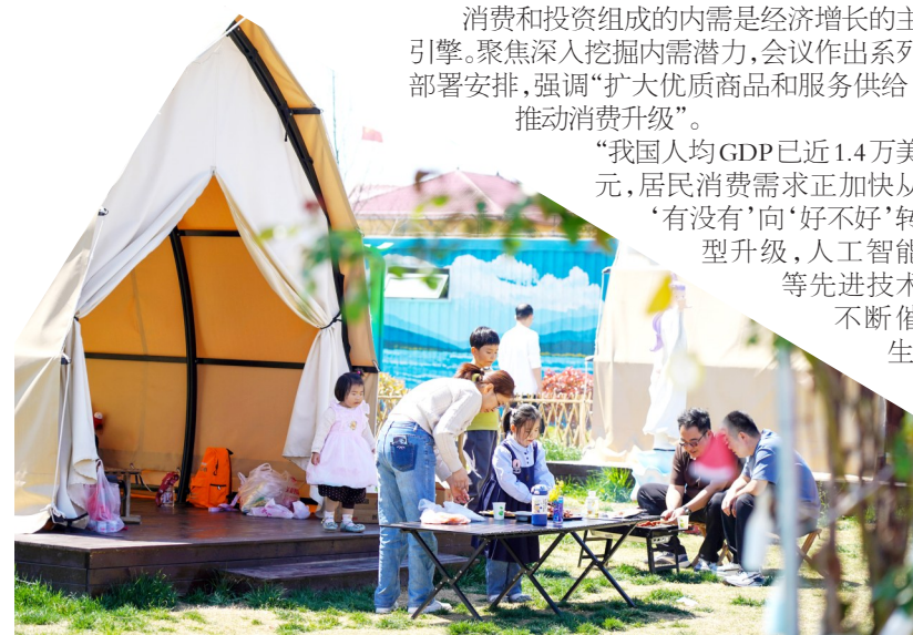
2026年4月4日，游客在山东省滕州市龙阳镇“龙湖月色”省级乡村振兴齐鲁样板片区内露营休闲。

中共中央政治局4月28日召开会议，分析研究当前经济形势和经济工作，强调“以更大力度和更实举措抓好经济工作”“增强经济发展内生动力”，并作出系列重要部署，为进一步坚定发展信心、牢牢把握发展主动、努力实现“十五五”良好开局指明前进方向。