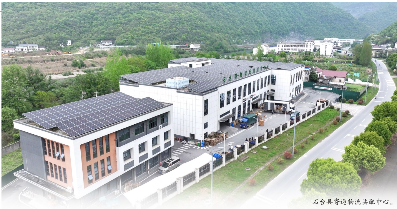
石台县寄递物流共配中心。