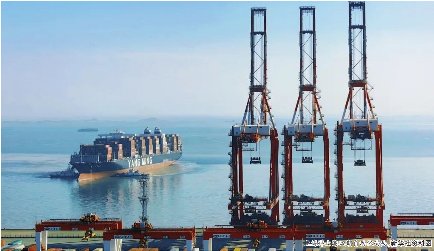
上海洋山港四期自动化码头