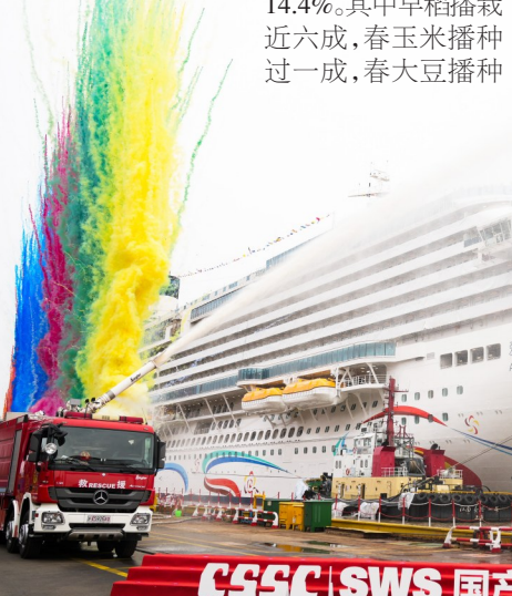
2026年3月20日在上海拍摄的第二艘国产大型邮轮“爱达·花城号”。