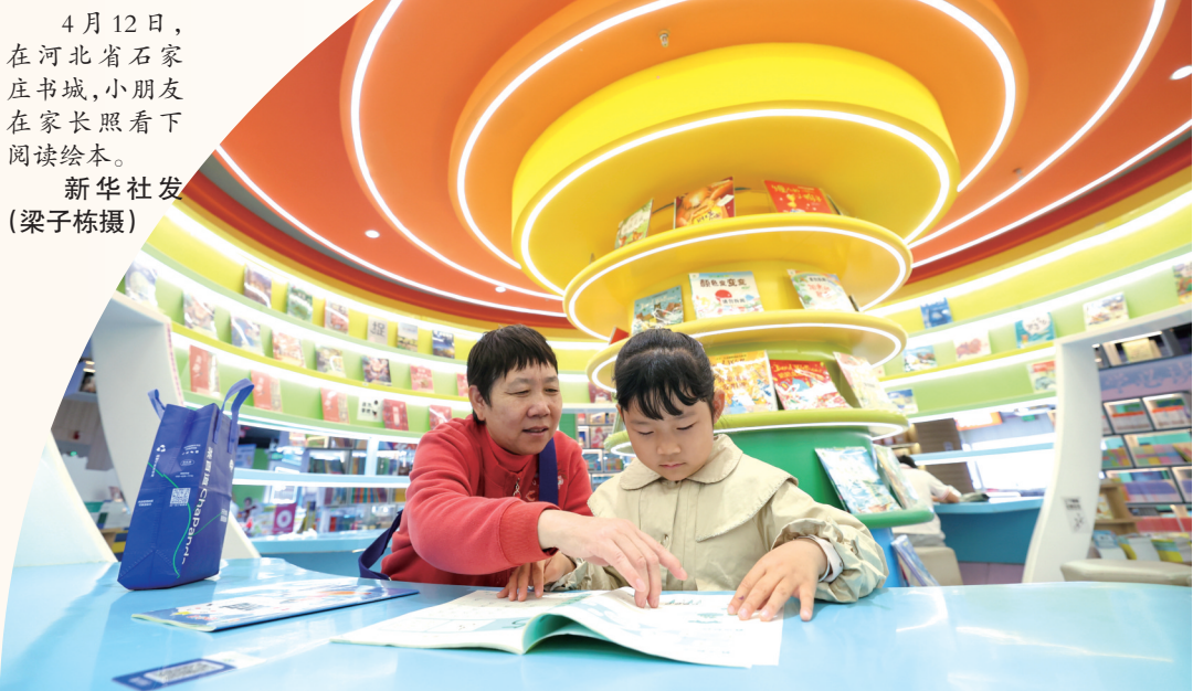
4月12日，在河北省石家庄书城，小朋友在家长陪同下阅读绘本。