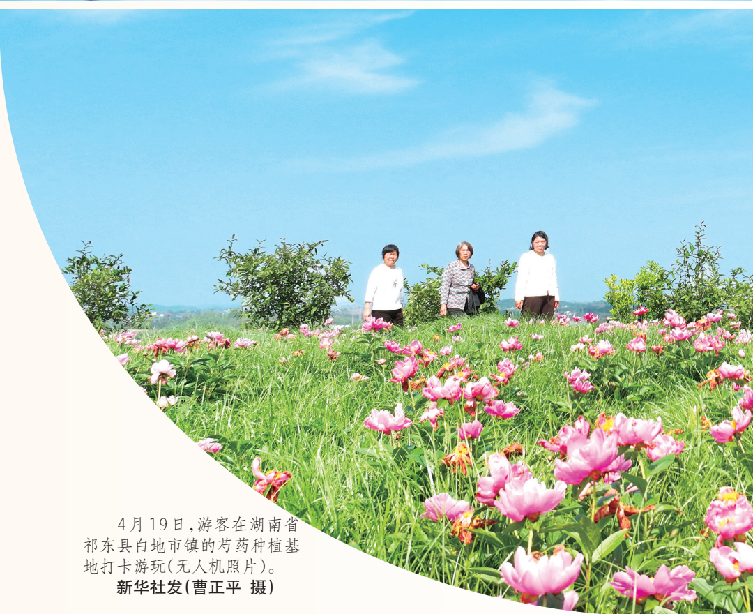
4月19日，游客在湖南省祁东县白地镇镇的芍药种植基地打卡游玩(无人机照片)。