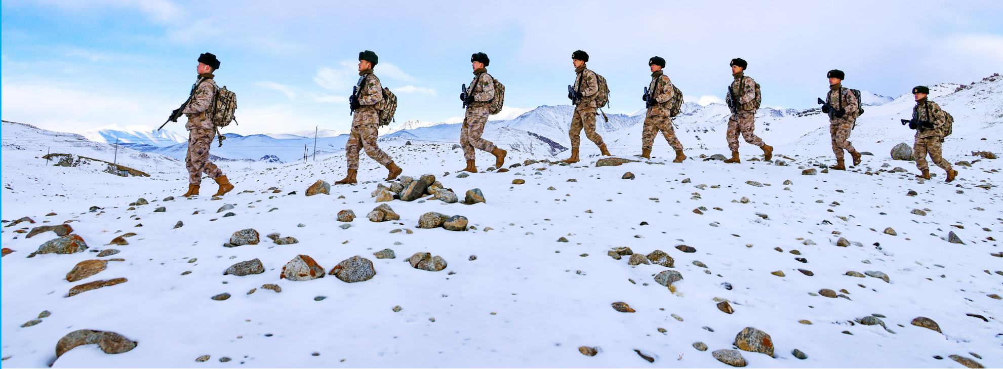
2024年2月9日，驻守帕米尔高原的新疆军区某边防团红其拉甫边防连官兵踏雪巡逻。