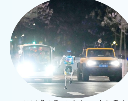
2026年4月11日晚,一台机器人在测试活动中奔跑。4月11日晚至4月12日凌晨,2026北京亦庄人形机器人半程马拉松全流程全要素测试活动在北京经开区举行。