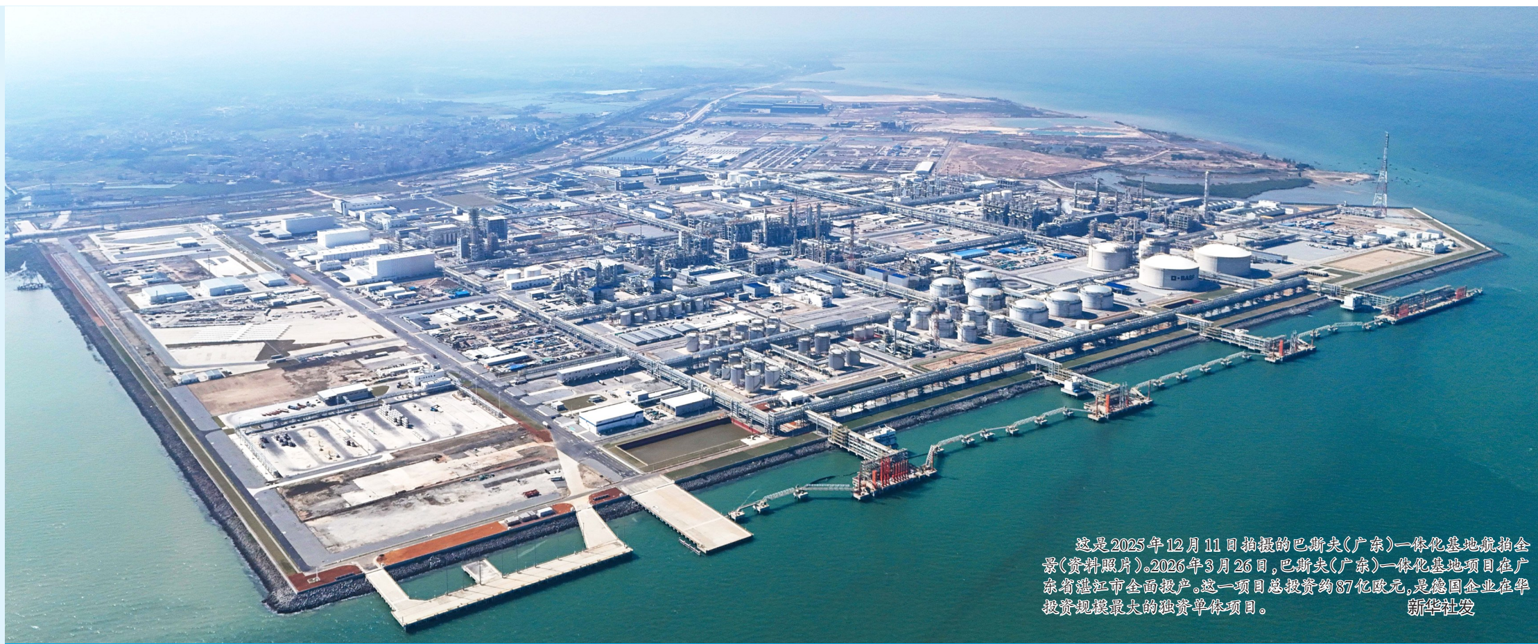
这是2025年12月11日拍摄的巴斯夫(广东)一体化基地航拍全景(资料照片)。2026年3月26日,巴斯夫(广东)一体化基地项目在广东省湛江市全面投产。这一项目总投资约87亿欧元,是德国企业在华投资规模最大的独资单体项目。