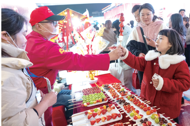
2月5日,“湖北新春国际消费季”活动在武汉启动。活动以“政策+活动+新场景+服务”四轮驱动,推动消费体验升级,为消费者打造多元化新春消费场景,持续释放消费潜力。