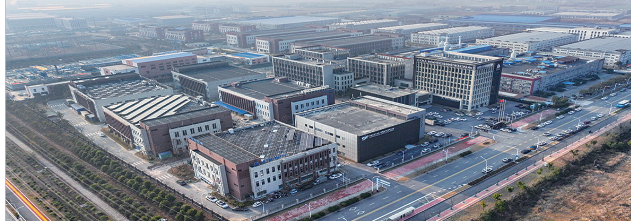
▼安徽中韩(池州)国际合作半导体产业园鸟瞰图

然；展望未来，信心十足。2024年，市经信局将深入贯彻全国新型工业化推进大会精神，全面落实省委“绿色智能制造强省”战略部署，紧扣“产业强市”战略目标，持续深化“熟悉企业、了解产业、把握政策、服务企业”工作思路，抓企业、育产业、优环境，确保各项工业经济指标稳定增长，为全市高质量发展扛起工业担当。(池经宣)