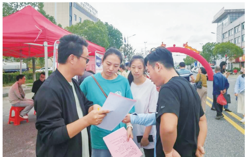
县人社局紧抓“双节”期间外出务工人员返乡契机,组织近30家优质企业参加全县重点项目重点企业节日专场招聘会,精准服务企业用工,促进劳动者充分就业。图为人社专员向求职者发放政策宣传页。

同时,该乡紧扣发展“一村一品”特色产业,通过“村集体+大户+农户”等模式,打造了茶溪椴木黑木耳种植大村、横山灵芝种植大村、祝山山下椴木香菇种植大村、苏村羊肚菌种植大村等特色产业村,全乡食用菌产值由8年前的700余万元,上升到2022年的1700多万元,食用菌产业迈上了高质量发展“快车道”。