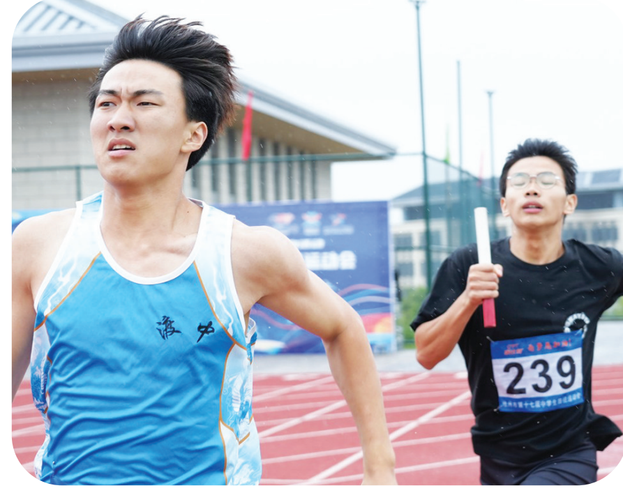
▲6月22日,池州市第十七届中学生田径运动会在池州工业学校举行,选手们在赛场上奋力拼搏。

这个夏天,精彩的各级别青少年赛事在我市陆续展开,而且项目非常广,覆盖田径、足球、排球、篮球、羽毛球、激光枪、游泳等众多项目。丰富多样的比赛在池城掀起一股中小