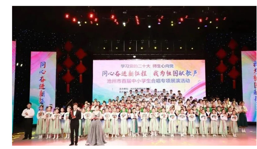
为深入学习贯彻党的二十大精神,深化理想信念教育,厚植爱国主义情怀,教育引导广大青少年从小坚定听党话、跟党走,建设向真、向善、向上的校园文化,7月15日下午,池州市举行首届中小生合唱专项展演,4个组别19个优秀合唱作品进行展演,参演学生达750余人。本次展演由池州市教体局主办,贵池区、东至县、石台县、青阳县教体局和九华山风景区管委会发展处、池州市合唱协会协办。