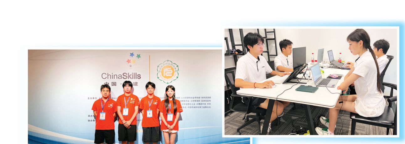
2023年全国职业院校技能大赛 2023 National Vocational Students Skills Competition 中职组电子商务运营赛项